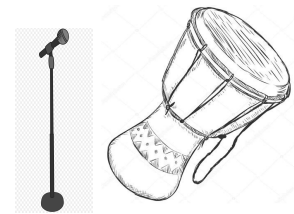
1 congas /1 djembé